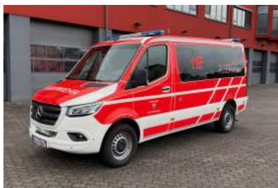
8/14/1 – MTW