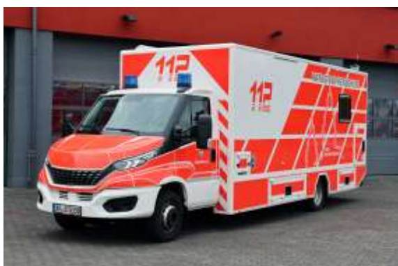
13/1 – Kater AB