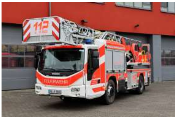
1/30/1 – DLK 23/12