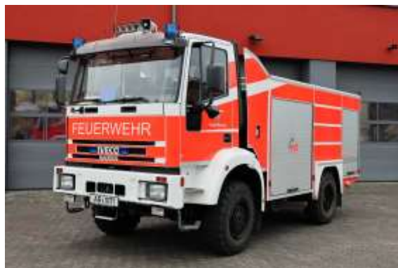
1/22/1 – TLF 16/24-Tr